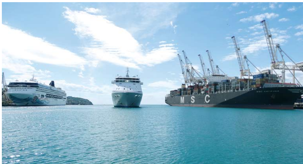
MSC Katrina (desno) je vključena v redni kontejnerski servis, ki Koper povezuje z Daljnim vzhodom.