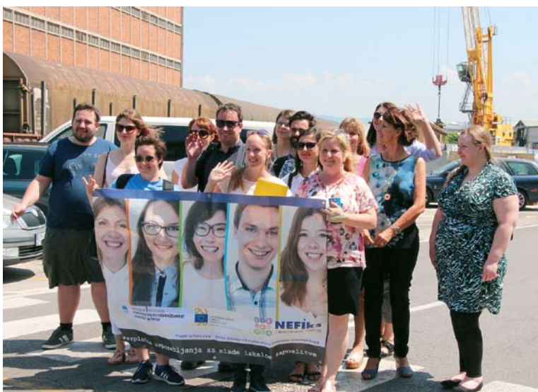
Dvoletni projekt »Nefiks zaposlitvene rešitve« financira Evropski socialni sklad in slovensko Ministrstvo za izobraževanje, znanost in šport in se bo zaključil letos septembra.

Predstavili smo jim naše delovne procese, potrebe po