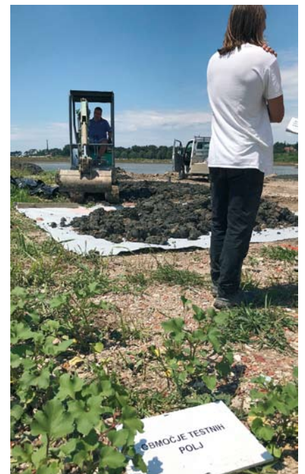
Pilotni projekt ožemanja mulja in uporabe tako pridobljenega materiala je v polnem zagonu.