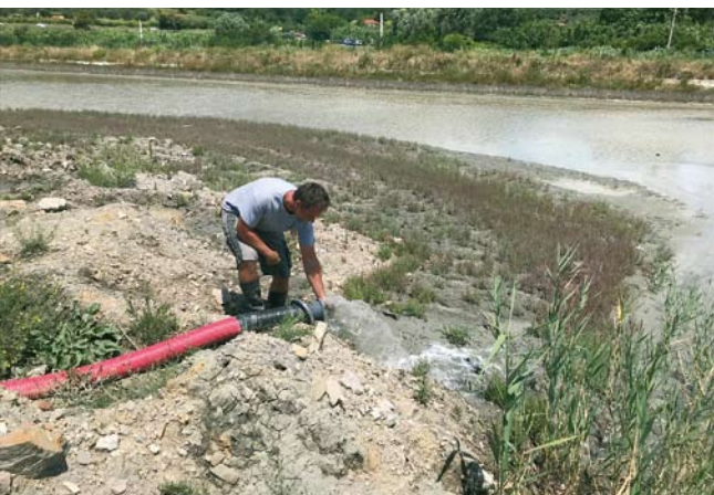
... stranski produkt – čista voda na drugi.

V Luki Koper se že od začetka pristaniške dejavnosti srečujemo z vprašanjem, kako ravnati z izkopnim materialom, ki nastaja pri vzdrževanju ustreznih globlin in poglobljanju luških bazenov. V preteklosti smo material (mulj, glina, pesek, kamenje in drugi sedimenti pomešani z morsk vodo) večinoma odložili v velike kasete, kjer se je postopoma sušil in zgoščeval. Kasete smo istočasno zasipavali s kamnitim ali podobnim materialom in tako ustvarili nosilno podlago.