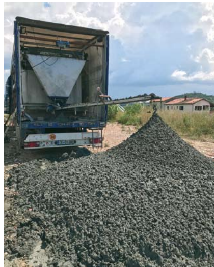
Končni produkt procesa ožemanja je suh in trden material na eni strani izhodne poti strojnega procesa in ...

Dosedanji način odlaganja materiala v pripravljene kasete (postopek se imenuje »refuliranje«) pa ni racionalen, saj material zavzame preveč prostora. V njem namreč ostane ujete še precej morske vode, zato tako zasedenih površin dolgo časa ne moremo uporabljati. Poleg tega imajo tako pridobljena tla tudi po delni osušitvi in dodatnem nasipavanju s kamenjem še vedno precej nizko nosilnost. Sčasoma se je pokazala tudi problematika večjega posedanja na ta način pridobljenih površin, večina teh površin pa niti kratkoročno ne more več prenesti velikih obremenitev, ki jih za skladiščenje tovora dosegamo danes.