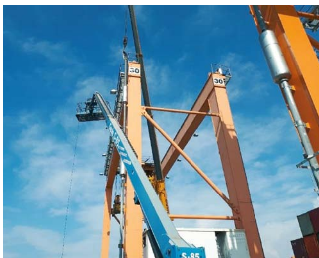
Na transtejnerjih, ki so med delovanjem oddajali precej hrupen zvok, smo izvedli več tehničnih nadgradenj. Med drugim smo na izpušno cev vgradili dodaten dušilec zvoka - srebrni valj zgoraj.

Čeprav se zdi rešitev pri tej naložbi preprosta, je bil sam poseg dokaj zahteven. Strojnice agregata smo najprej izolirali z zvočnim izolacijskim materialom tako, da smo jo »oblekli« s paneli, dodali nove difuzorje, ki omogočajo dušenje zvoka in nato izolirali še izpušno cev ter ji dodali dodaten dušilec zvoka.