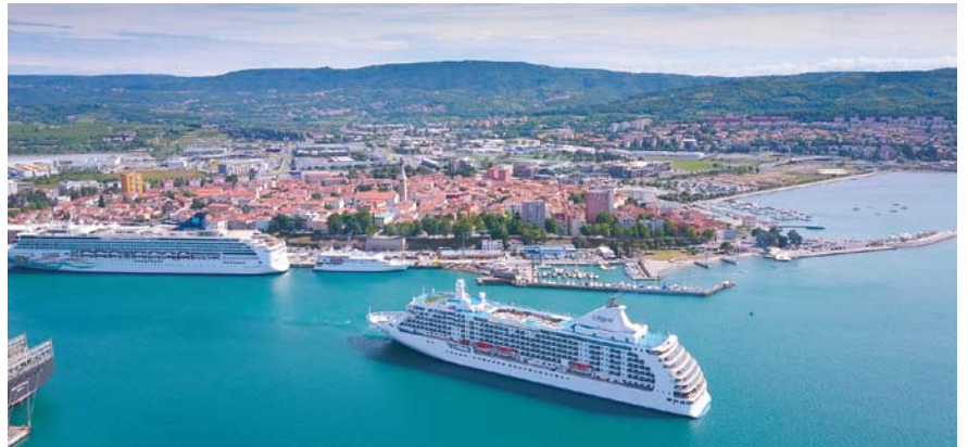
Seven Seas Voyager prihaja v luko Koper, kjer sta že privezani Norwegian Spirit in Crystal Esprit.

V Koprju privezana 268-metrška ladja Norwegian Spirit na krov sprejme 2.150 potnikov, za katere skrbi kar 965 članov posadke in je iz Benetk priplula v Koper. Druga obiskovalka naše luke je bila Seven Seas Voyager, dolga 207 metrov, na kateri lahko potuje 700 potnikov in 447 članov posadke, ki je k nam prav tako prišla iz Benetk. Ladji sta proti večeru zapustili slovensko morje, prva se je usmerila proti Splitu, druga pa v Dubrovnik. Oba ladjarja, tako Norwegian Cruise Line kot Regent Seven Seas Cruises potnike zajemata na severnoameriškem trgu. Prvi bo s svojo floto Koper letos obiskal 10-krat, vsakič v petek in z itinerarijem od Benetk do Grčije, Regent pa ponuja programe višjega cenovnega, 6-zvezdičnega ranga z vključenimi izleti na destinacijah, zato je