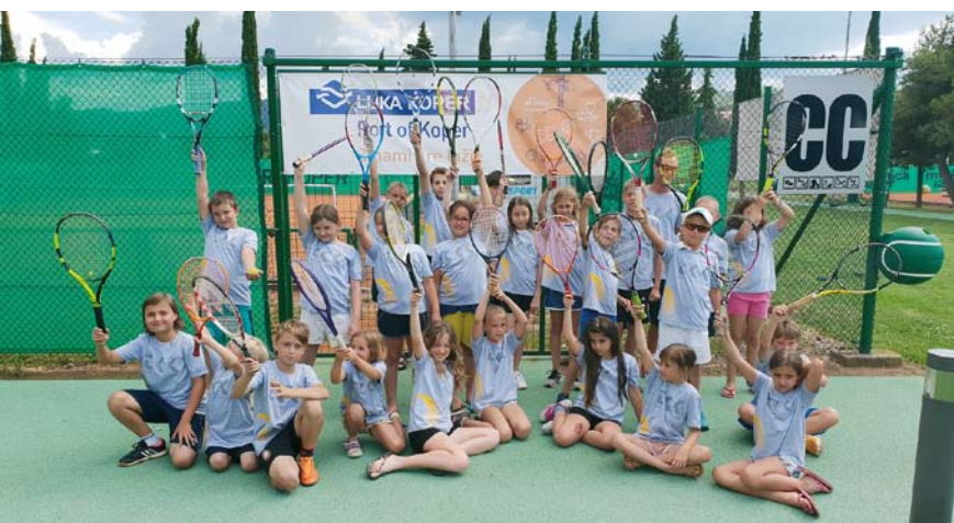
V poletnih mesecih klub organizira teniške kampe, ki so zelo dobro obiskani.