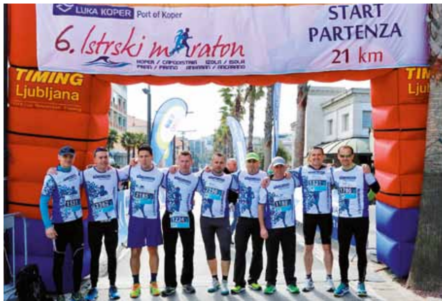
Polmaratonci na štartu v Kopru.

»Dogodek je bil tudi letos dobro organiziran in mislim, da je zelo lepo, da sponzoriramo takšne prireditve, ko imamo vsi nekaj od tega. Najbolj pomembno je druženje, dobra volja in