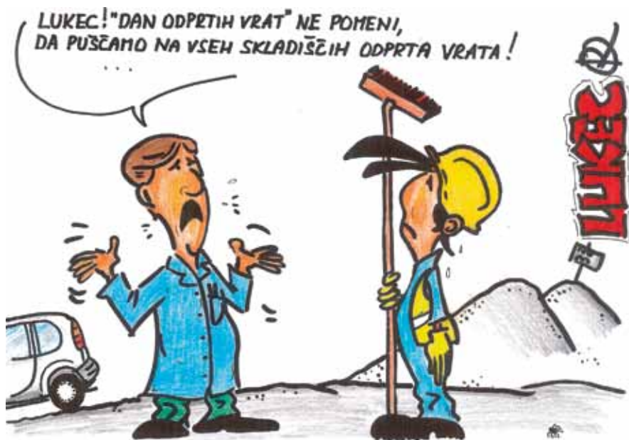
Lukec iz leta 2007, ko smo prvič pripravili Dan odprtih vrat, danes Pristaniški dan.