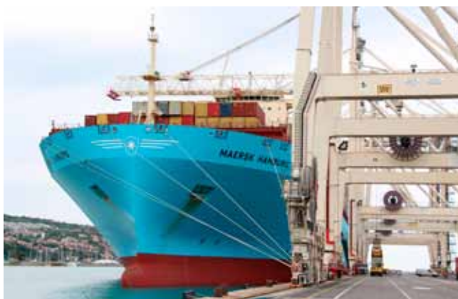
Maersk Hamburg in njene sestre bodo Koper po novem povezovale z Daljnim Vzhodom na redni liniji vsak ponedeljek, tako da bo priložnosti za občudovanje velikih kontejnerjač v Koprno še precej.