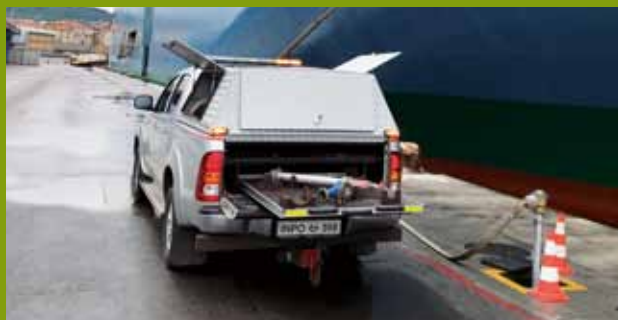
Priklop za pitno vodo se na ladji nahaja večinoma na samem robu palube. Ladje za vozila (na sliki), vojaške ladje in potniške pa imajo posebne odprtine ali pokrove.

Količina naročene vode je odvisna od same ladje, pretaka se od 5 pa vse do 800 m 3 . Med pretakanjem privezovalci večkrat opravijo obhod, s čimer nadzorujejo postopek in pazijo, da ne bi prišlo do puščanja ali prekoračene količine, ki je bila naročena. Ob zaključku se ponovno preveri in podpiše stanje na števcu.