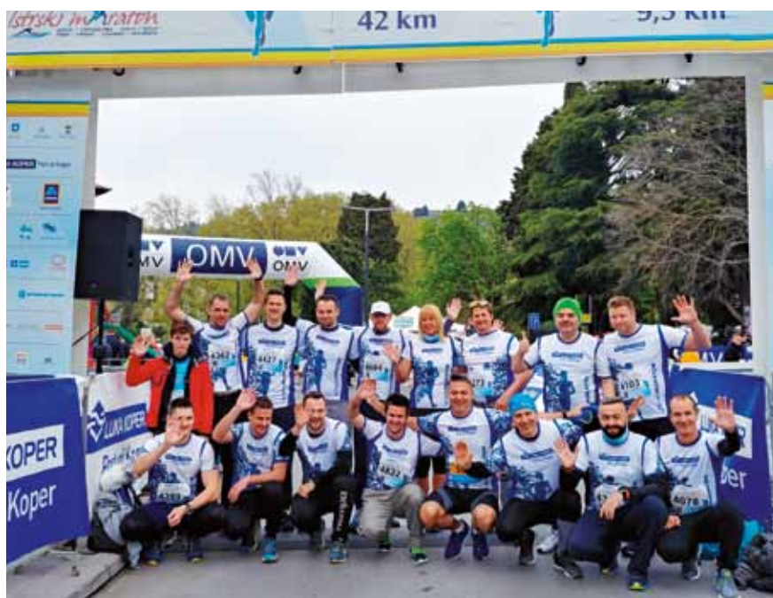
Glavno prizorišče dogodka je bilo letos v Portorožu, kjer je bil štart maratona in rekreativnega teka.

doseganje zadanih ciljev.« Erik Slama , Potniški terminal