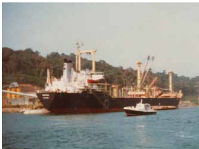
Z ladjo Bočna so v Koper vozili hlodovino iz Afrike.

o tvoji usposobljenosti, pooblastilih in opravljenih zdravniških pregledih. Sam imam štiri matrikole, dve še jugoslovanski in dve slovenski.