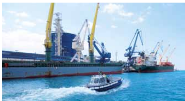
Novo plovilo privezovalci že uporabljajo.