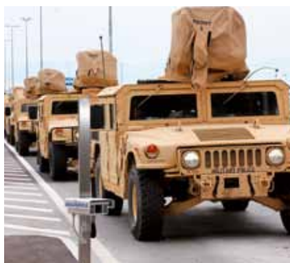
Oprema je v konvojih zapustila pristanišče in odpotovala na lokacijo vojaških vaj.