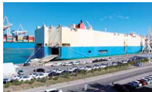
Lani smo v Luki Koper pretovorili 754.000 vozil, kar koprsko pristanišče uvršča med največje avtomobilske terminale v Sredozemlju in Evropi.

Daimler je sodelovanje z Luko Koper podaljšal na podlagi dosedanega zadovoljstva s storitvami, visoko stopnjo varnosti in specifičnimi izkušnjami pri pretovoru in skladiščenju tako občutljivega blaga kot so avtomobili. V prihodnje bomo sodelovanje nadgradili tudi z dodatnimi storitvami, ki jih bomo izvajali med postankom vozil v pristanišču.