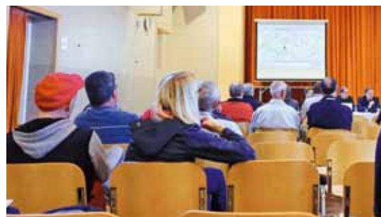
Zbor krajanov v Dekanih, kjer je bila ena od tem tudi drugi tir.

Zaradi bojazni pred poslabšanjem kakovosti življenja v času gradnje drugega tira so v krajevnih skupnostih Škofije, Dekani in Gabrovica v maju potekali zbori krajanov, kjer so predstavnika družbe 2TDK, glavni projektant (SŽ-Projektivno podjetje) in glavni nadzornik (DRI upravljanje investicij) odgovarjali na vprašanja krajanov. Zborov sta se udeležila tudi župan