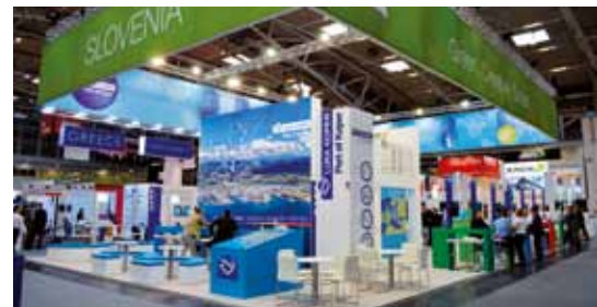
Slovenska stojnica obsega kar 280 m 2 razstavne površine in predstavlja prednosti logistične poti preko Slovenije.

Letošnji sejem je rekorden, saj so organizatorji pritegnili kar 2.360 razstavljalcev. Izstopajo kitajski logisti, katerih število se je v primerjavi z lanskim sejmom kar podvojilo. Ob robu dogodka se je zvrstilo kar 50 forumov na teme svetovnega gospodarstva, digitalizacije, pomanjkanja voznikov in kvalificiranih delavcev ter trajnostne logistike v mestih. Velik poudarek je tudi na železniškem transportu in večina držav napoveduje zelo konkretne premike tovora s ceste na železnico. Na področju pristanišč pa so letos v ospredju dodatni stroški za ladjarje zaradi