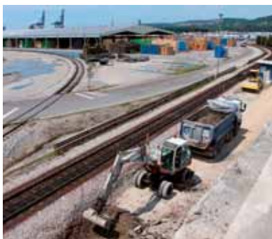
Šesta skupina tirov, ki bo povečala produktivnost in omogočila prihod daljših vlakovnih kompozicij v luko Koper se že gradi.

Pričeli smo že z gradbenimi deli za izgradnjo t. i. šeste skupine tirov v zaledju tretjega bazena. Izvajalec je Kolektor CPG, investicija pa vredna 3,186 mio €. Gre za navezavo na obstoječo luško železniško omrežje in izgradnjo štirih tirov, vsak dolžine najmanj 700 metrov. Pred kratkim smo končali z izgradnjo tira 61 ter kretnice 601 in povezave do nivojskega prehoda, s čimer smo končali 1. fazo. Druga in tretja faza obsegata gradnjo štirih tirov, saj se bo en v luko prihajajoči tir