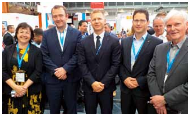
Stojnico Luke Koper je obiskalo tudi vodstvo Slovenskih železnic.