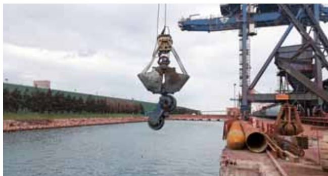
Sanacijska dela so upočasnili nepredvideni dogodki, npr. v mulj zakopani kosi porušenega dvigala, kjer bi morali zabiti pilote.