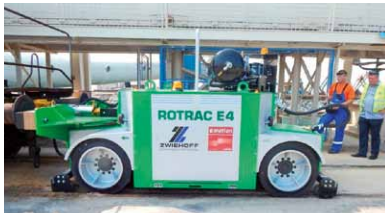
Bistvo dvopotnih vozil je možnost premika po cesti in železniških tirih (ima kovinska kolesa in gume). Novi vozilobosta električni in daljinsko vodeni.

Rotrac E4 je visoko učinkovit in optimalno izkorišča energijo. Opremljen je s funkcijo povečanja za visoko zmogljivost zagona, ima reguliran popolnoma sinhroniziran neodvisni kolesni pogon, brezstopenjski nadzor hitrosti, robustna, rebalansirna in kompenzacijska vodila, prilagodljivo krmiljenje vozila, kompenzacijo med tirnicami brez tlaka, kompaktno oblika z nizkim težiščem, sistem proti zdrsu pogonskih koles