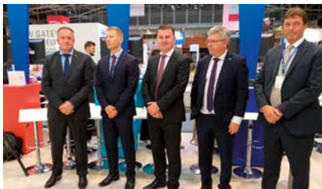
Gospodarski minister Slovenije Zdravko Počivalšek (levo) je izpostavil strateško lego Slovenije, logistično tradicijo ter pomembne aktualne investicije na področju transporta. Luka Koper je na sejmu predstavljala številčna delegacija - član uprave Metod Podkrižnik (drugi z leve), komercialisti (desno vodja Področja komerciale Mitja Dujc ) in predstavniki različnih terminalov.