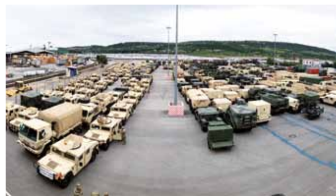
V luki Koper smo skladiščili preko 350 specialnih vojaških vozil.