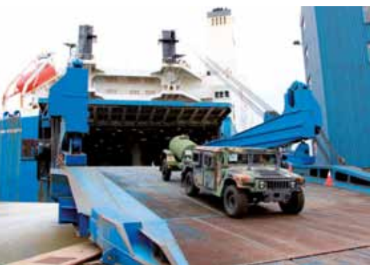
Vojaško opremo ameriške vojske je v Koper pripeljala ladja Endurance (slo. Vzdržljivost), s katere smo jo brez težav raztovorili v nekaj urah.